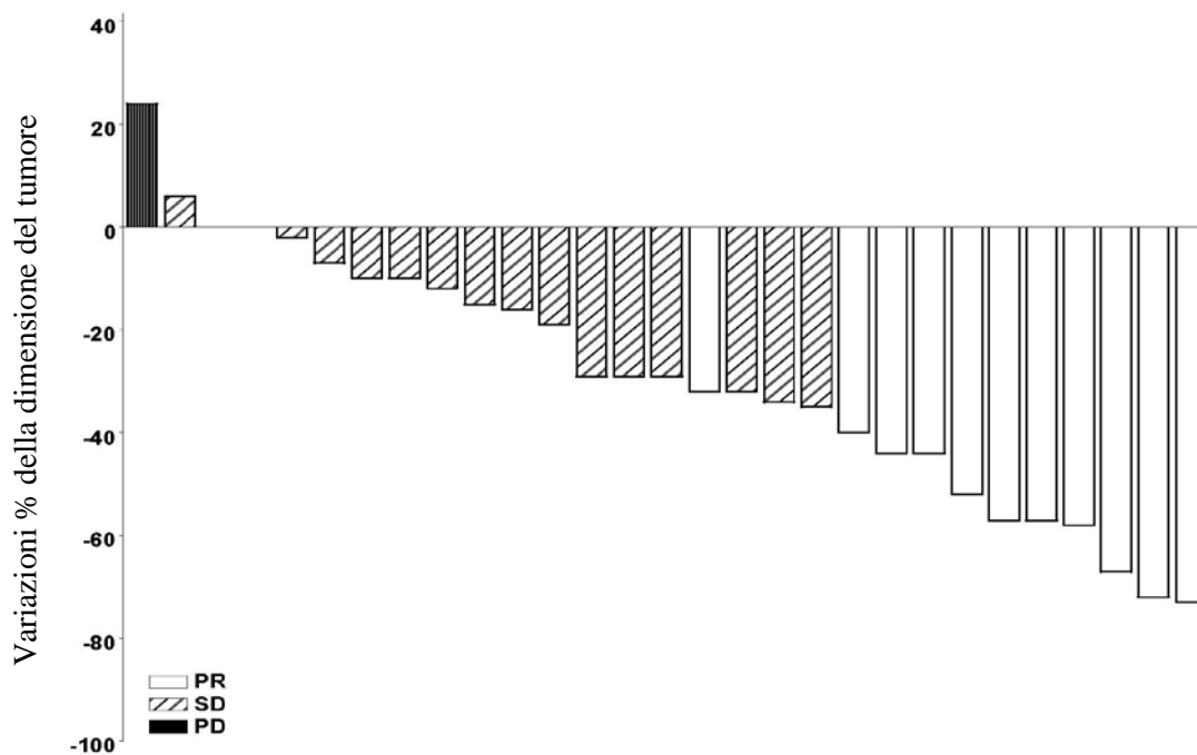
Figura 1 SHH4476g Coorte BCC metastatico

Nota: la dimensione del tumore è basata sulla somma dei diametri più lunghi delle lesioni target. PD = progressione della malattia, SD = malattia stabile, PR = risposta parziale. 3 pazienti hanno mostrato una variazione percentuale migliore della dimensione del tumore pari a 0 e, nella figura, sono rappresentati dalle barre positive minime. Quattro pazienti sono stati esclusi dalla figura: 3 pazienti con malattia stabile sono stati valutati solo sulla base delle lesioni non target e 1 paziente è risultato non valutabile.