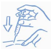
Obrázek A: Zlehka stiskněte kůži a aplikujte podle návodu