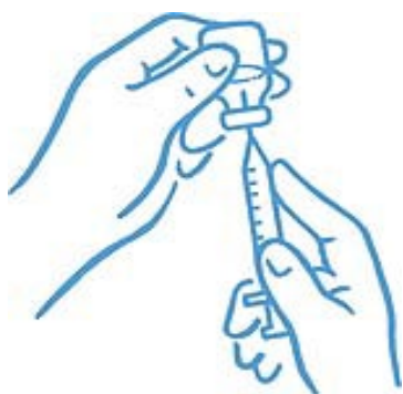
Obrázek 4: Hrot v tekutině