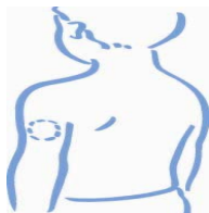
Horní část paže