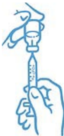
Obrázek 6: Odstraňte bubliny a doplňte správnou dávku